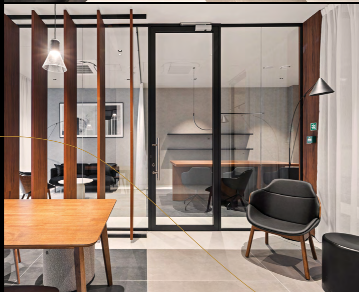
Części wspólne: recepcja/ lobby / strefa co-working