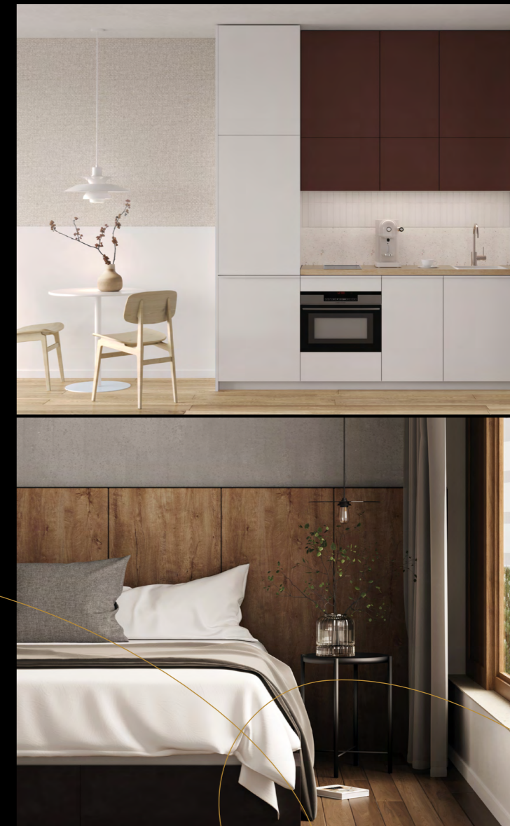
Dwa style wykończenia: jasny NATURO oraz ciemny URBAN